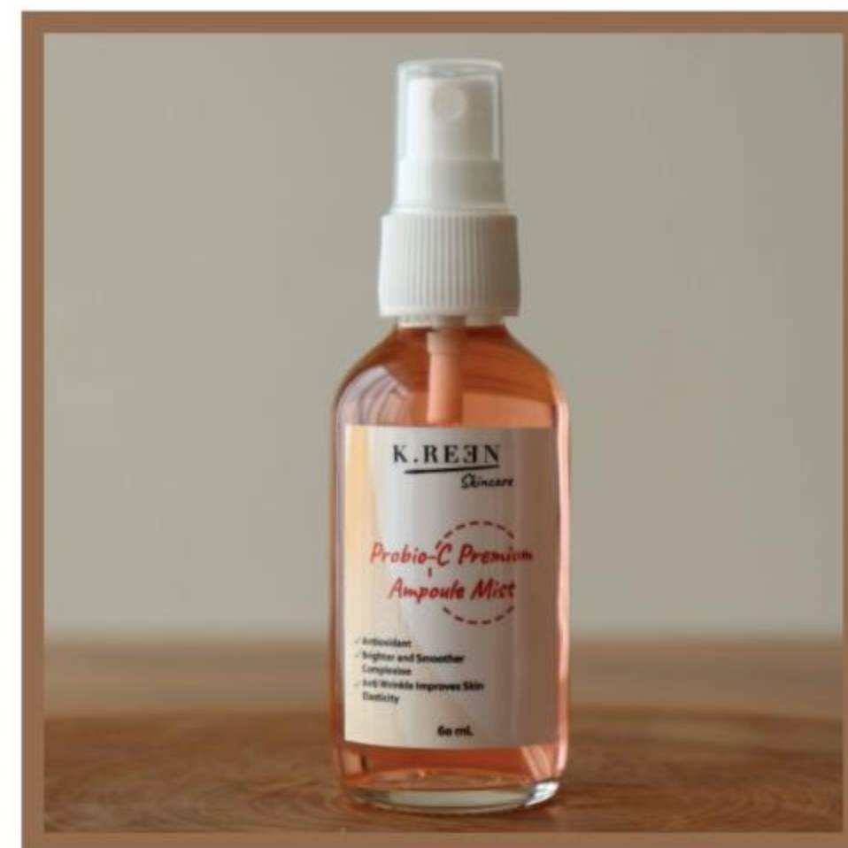
PROBIO-C PREMIUM AMPOULE MIST