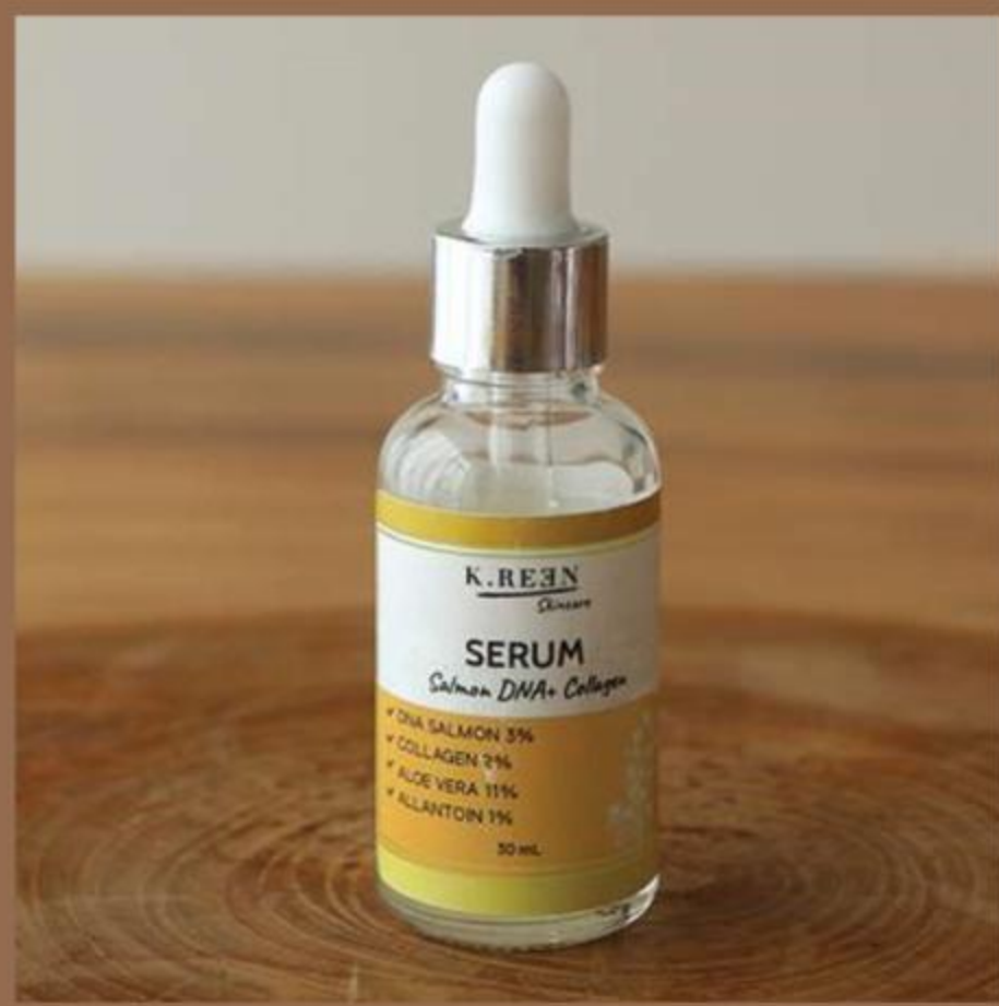
SALMON DNA + COLLAGEN SERUM